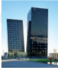
NH Hotel Fiera Viale degli Alberghi, 1 20017 Rho (MI)